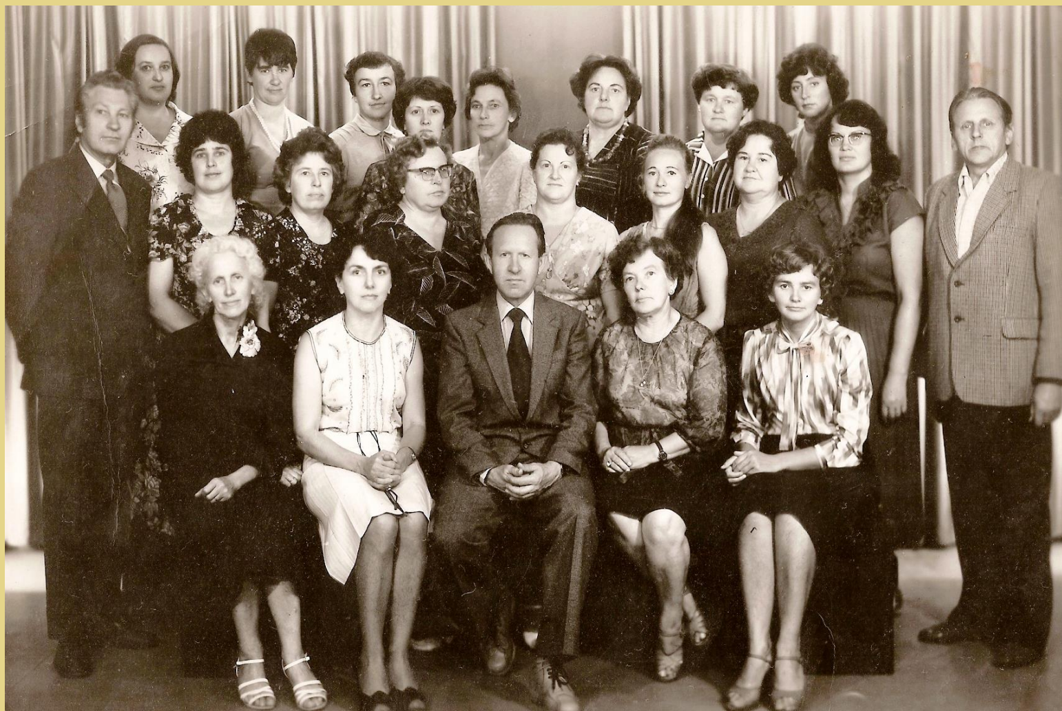
Tauragės vakarinės mokyklos mokytojai 1983 m. rudenį