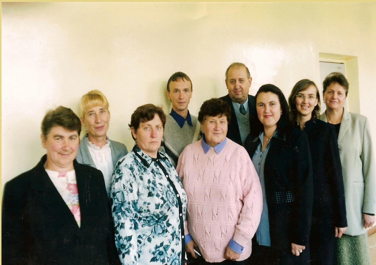
SMC mokytojai (1999 m.)