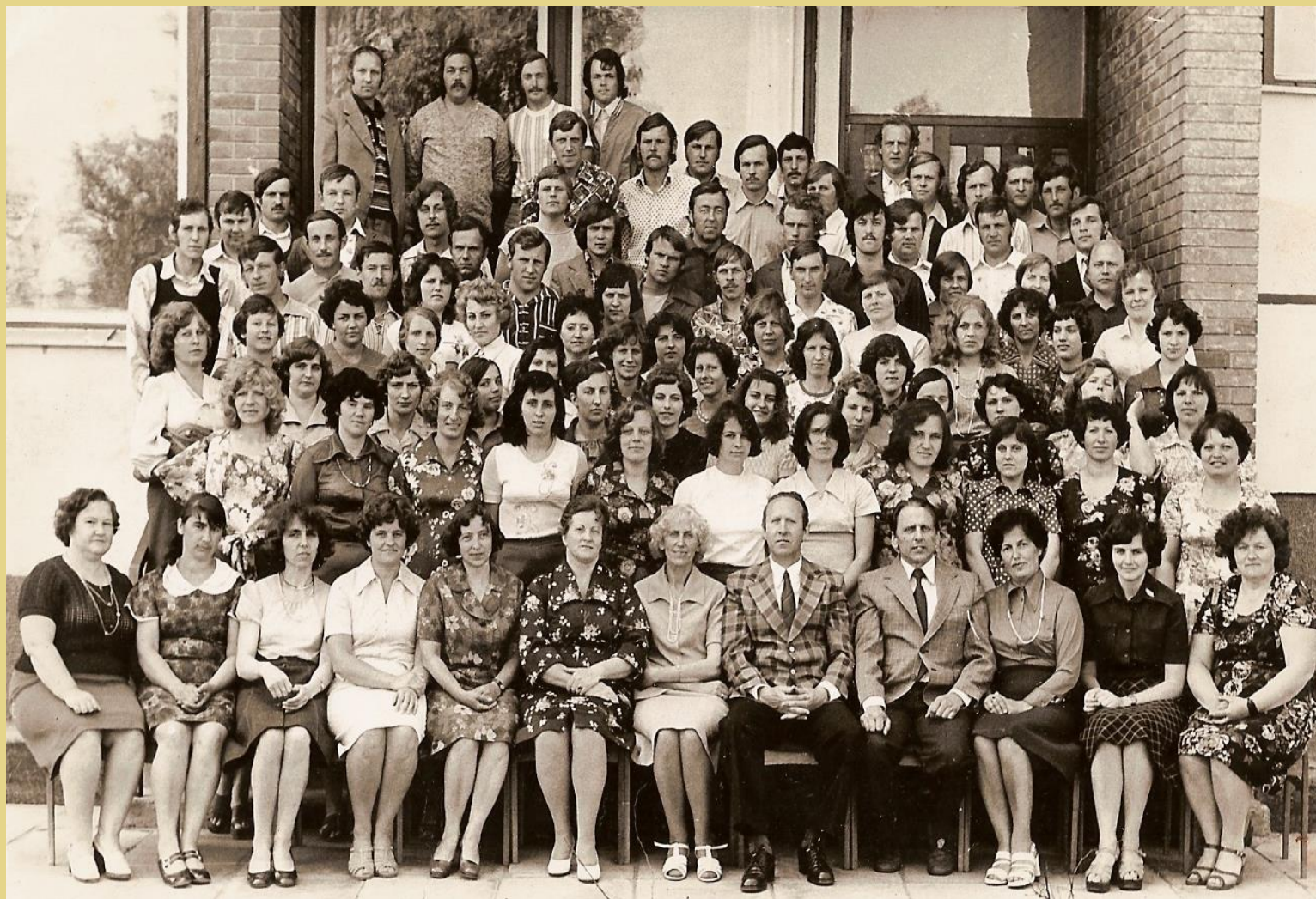
Tauragės vakarinės – sesijinės mokyklos bendruomenė 1977 m.