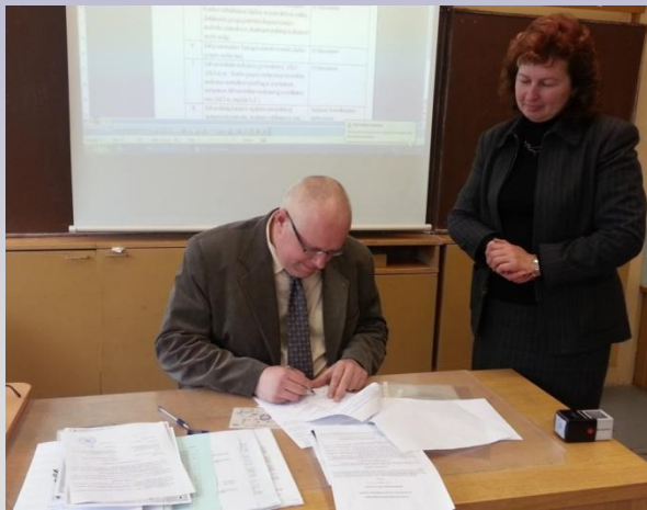
Pasirašoma bendradarbiavimo sutartis su Darbo birža