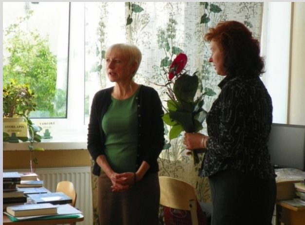
Viešnia - rašytoja Birutė Jonuškaitė